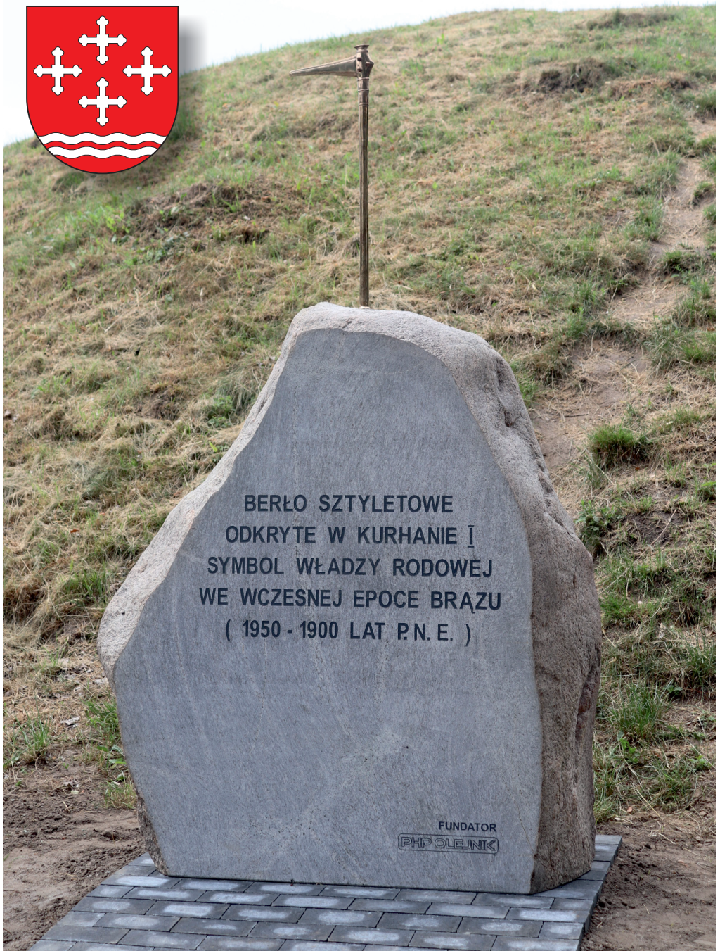
Kamienny obelisk znajdujący się przy kurhanie nr 1 w Łękach Małych