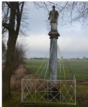
Figura Św. Wawrzyńca