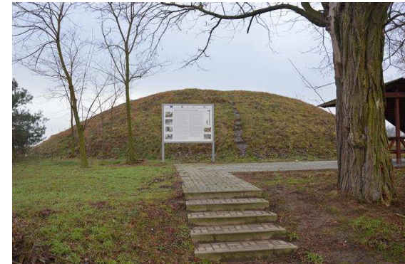
Kurahany – „Wielkopolskie piramidy”