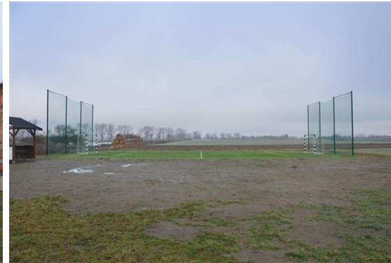
Boisko do piłki nożnej