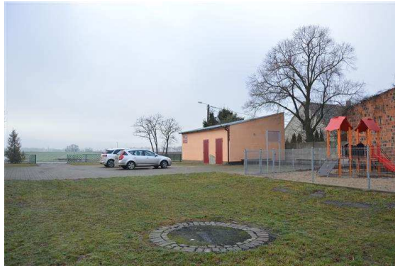
Teren przy Sali wiejskiej