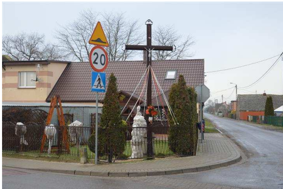
Krzyż w centrum wsi

Z przeprowadzonej wizji w terenie sporządzono dokumentację fotograficzną.