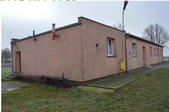
Sala wiejska w Wilanowie