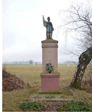
Figura Św. Floriana